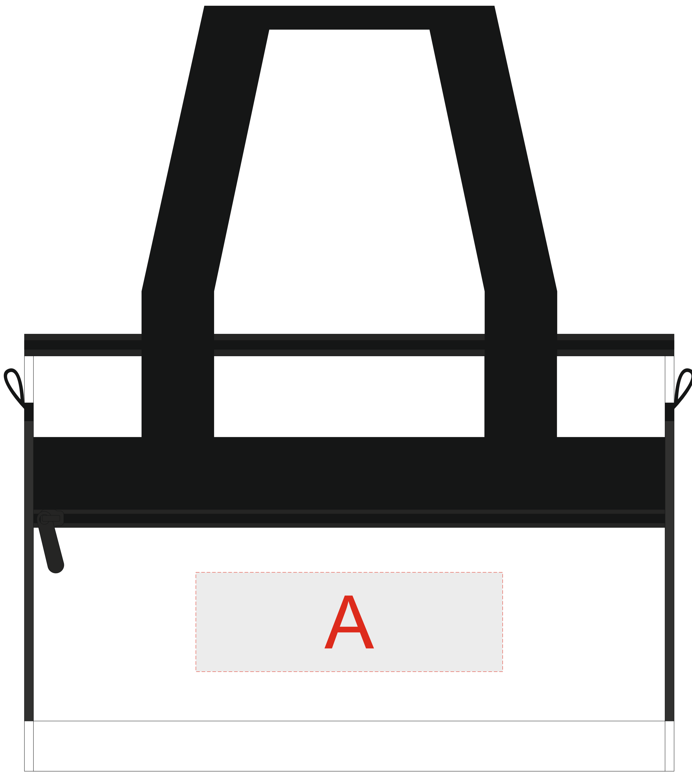
вид спереди (карман)